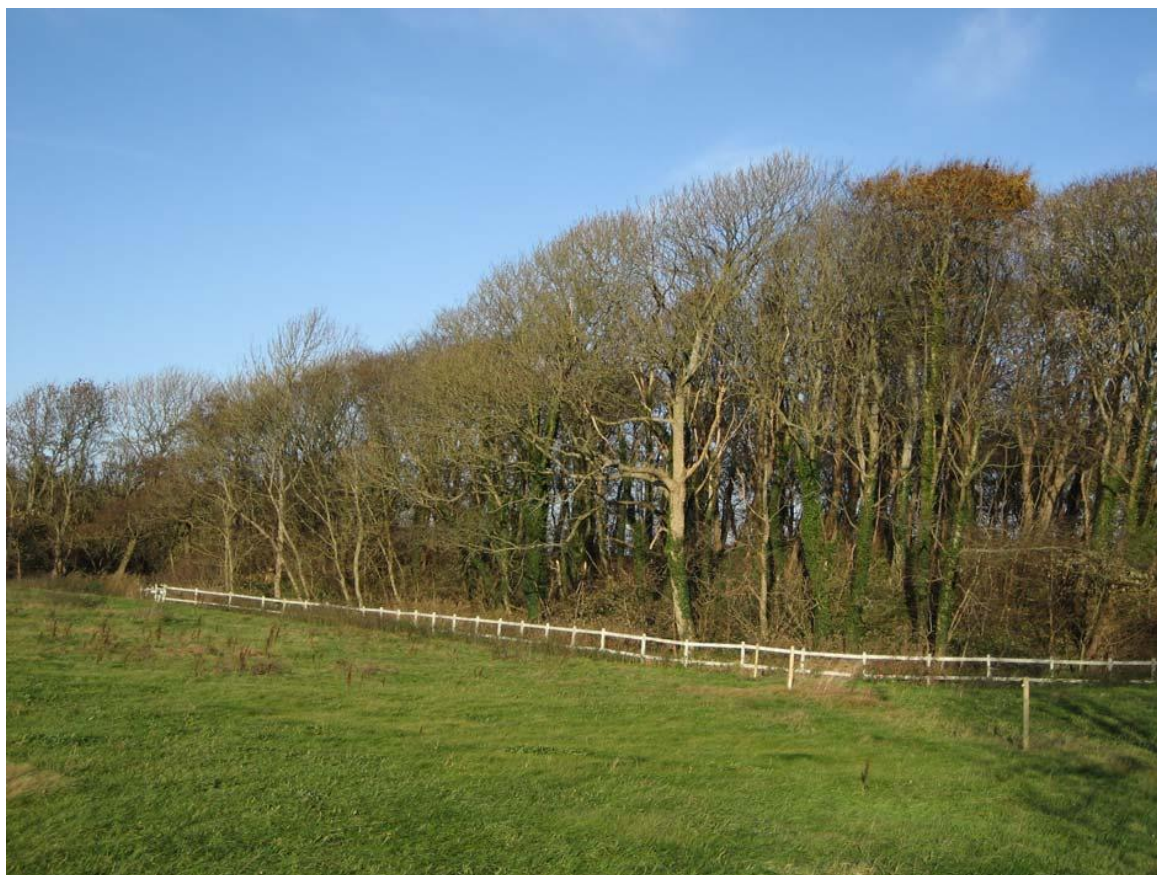
Ågård med en del af engen. Kirsten Monrad Hansen 2006.

Sted/topografi: Ågård i Vester Han herred ligger syd for den nuværende by Fjerritslev. Voldstedet er i dag omgivet af engdrag, som oprindeligt var en sø. I dag løber Mølleå nord og nordvest for anlægget, og nord for Ågård findes der også et mindre vådområde.