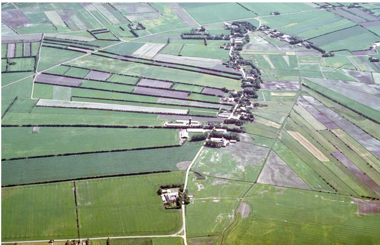
Luftfoto af Bejstrup. Nordjyllands Amt.

Udskiftningen på morænejorden fremtræder tydeligt med jorddiger og læhegn langs skellene.