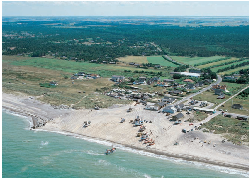
Foto af Thorupstrand taget i 2002.

Der har været udpræget sandflugt i området især vest for Thorupstrand, og det var grunden til, at et stort område blev tilplantet i slutningen af 1800-tallet. Sporene efter sandflugten kan fx iagttages ved den store parabelklit i Thorup Klitplantage, der standser kun en kilometer vest for byen, og hvis arme rækker ca. 3-4 km mod vest.