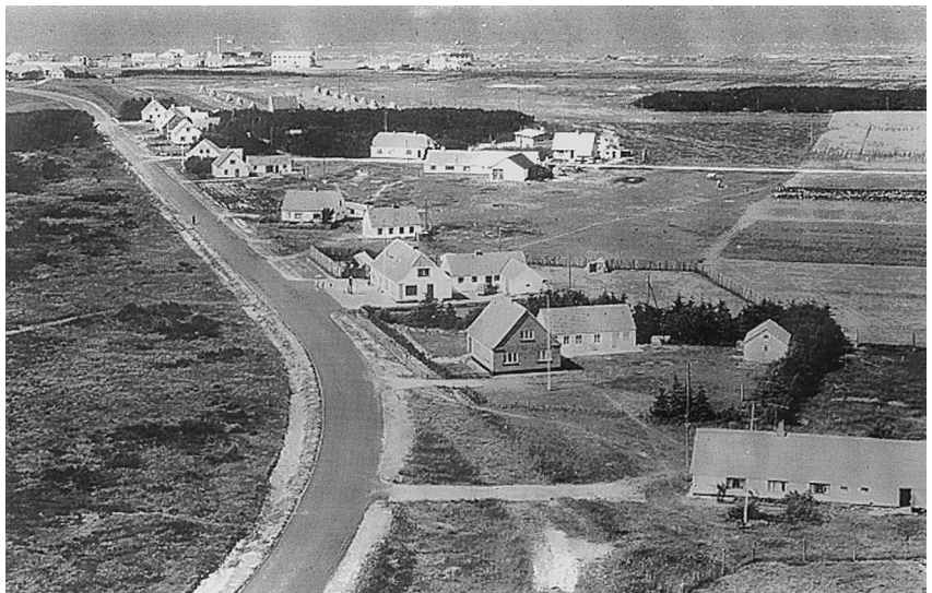
Udsigt over Thorupstrand o. 1950, da der var frit udsigt til Jammerbugten.

Gårdene i Thorupstrand er beliggende dels helt ude langs kysten (4 stk.) og dels på nordsiden af Havvejen, der løber parallelt med kysten. Disse gårde ligger som en perlerække hele vejen til Kollerup Strand. Strandgården ligger lidt tilbagetrukket fra havet, men ikke så langt inde i land som de sidstnævnte gårde. Gården ligger lige øst for vejen til stranden (se kort).