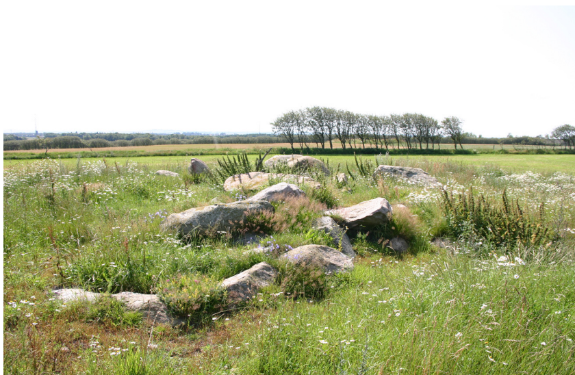
Den nordlige jættestue ved Gundestrup Mark. Aalborg historiske Museum 2005.

Højen mellem de to jættestuer er aldrig udgravet, muligvis kan også denne indeholde en jættestue. Det andet interessante element i udpegningen er forekomsten af en langdysse, der ligeledes i forhistorisk tid har udgjort den ene part i et par, hvor den ene nu er borte. Den tilbageværende langdysse var ikke tilgængelig på besigtigelsestidspunktet, men skal indeholde to kamre med dæksten. Desværre løber en højspændingsledning hen over dette område, og den tager noget af opmærksomheden fra oplevelsen.