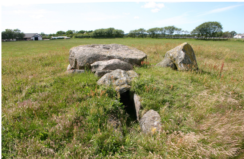
Den sydlige jættestue ved Gundestrup Mark. Aalborg historiske Museum 2005.

Højen mellem de to jættestuer er aldrig udgravet, muligvis kan også denne indeholde en jættestue. Det andet interessante element i udpegningen er forekomsten af en langdysse, der ligeledes i forhistorisk tid har udgjort den ene part i et par, hvor den ene nu er borte. Den tilbageværende langdysse var ikke tilgængelig på besigtigelsestidspunktet, men skal indeholde to kamre med dæksten. Desværre løber en højspændingsledning hen over dette område, og den tager noget af opmærksomheden fra oplevelsen.