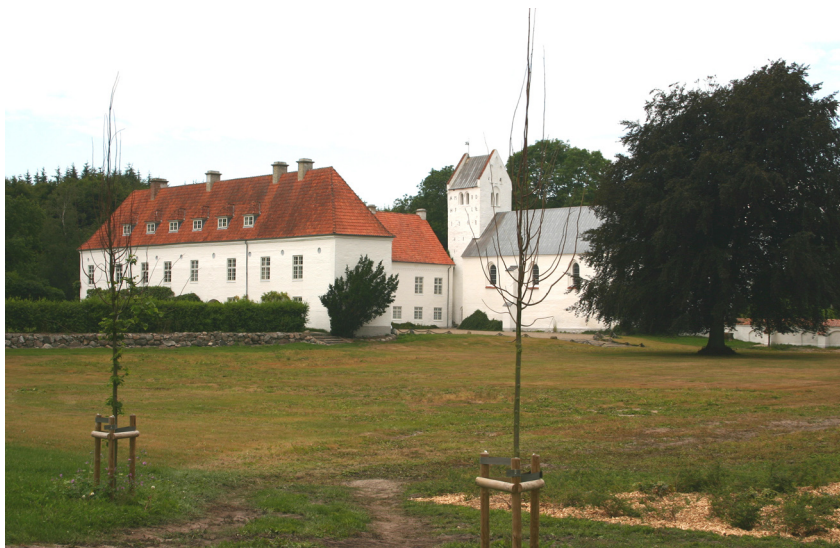
Oksholm og Øland kirke.

Kirken er hvidkalket, og taget er tækket med bly. På nordsiden er hovedskibets tag forlænget ned over sideskib og kapel. Det store kirkerum er forsynet med ribbehvælv, og disse modsvarer af udvendige stræbepiller; dog er de to stræbepiller på hovedskibets sydside af nyere dato og bygget efter korsgangen blev revet ned. Hovedskibets vestligste fag har i klostertiden været delt i to stokværk, hvoraf det øverste har udgjort nonnekoret. Dette var ved en arkade forbundet med tårnrummet, hvori der stadig ses spor af en muret trappe, som har ført op til nonnekoret. Adgang til kirken fra klosterbygningerne har formentlig fundet sted gennem de nu tilmurede døråbninger i hovedskibets sydside.