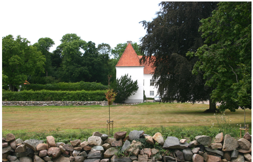
Oksholm og Øland kirke.

Også i vestfløjen finder man som nævnt middelalderligt murværk, men efter flere større ombygninger og især efter en brand i 1870 er dette vanskeligt at erkende. Midt for vestfløjen, ind mod gårdsiden, opførtes der i 1870 et rundt trappetårn på ældre fundamenter. Senere er dette trappetårn revet ned og erstattet af en kort udløberfløj, hvori der befinder sig et trapperum.