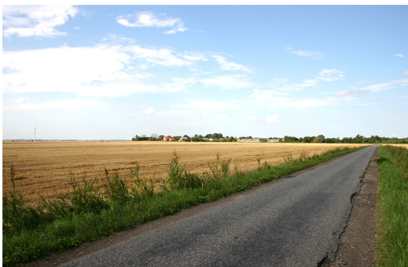
Østerby på strandvolden.

Tilsvarende blev Østerby placeret midt mellem ager og fjord, dog med sin beliggenhed på en strandvold ud mod Limfjorden, uden vejbyens langstrakte og slanke karakter. For begge byer har placeringen på de naturligt afgrænsede arealer modvirket en udflytning af den fra gammel tid samlede bebyggelse