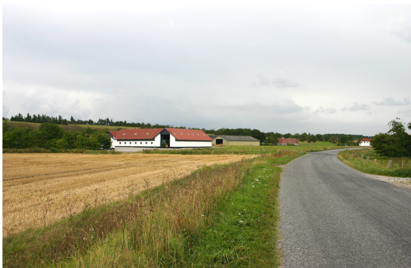
Vesterby nedenfor Ølands højland.

Tilsvarende blev Østerby placeret midt mellem ager og fjord, dog med sin beliggenhed på en strandvold ud mod Limfjorden, uden vejbyens langstrakte og slanke karakter. For begge byer har placeringen på de naturligt afgrænsede arealer modvirket en udflytning af den fra gammel tid samlede bebyggelse