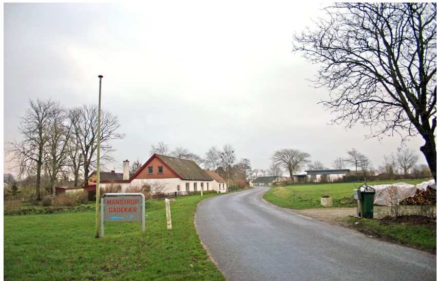
Manstrupvej set fra nordvest.

En fremtidig regulering og udvikling af kulturmiljøets værdier bør baseres på udarbejdelsen af en bevarende lokalplan for området. I denne sammenhæng skal det nævnes, at Fjerritslev Kommune allerede har udviklet en lokalplan for området Bejstrup og Bejstrup Sogn, og dermed Manstrup, men foreløbigt uden bevarende bestemmelser for kulturmiljøet Manstrup.