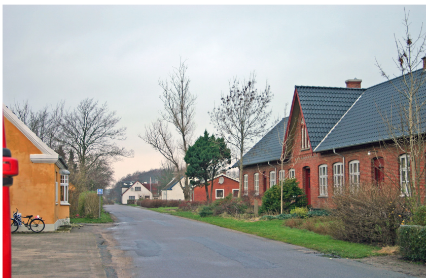
Sigurdsholmsvej set fra syd. Aalborg historiske Museum 2006.

Bebyggelsesbilledet synes ikke at have ændret sig meget før efter 1880'erne, hvor fortens udformning fra aftegningerne på kortet ser ud til at være påbegyndt drænet med kanaler. I hvert fald synes antallet af