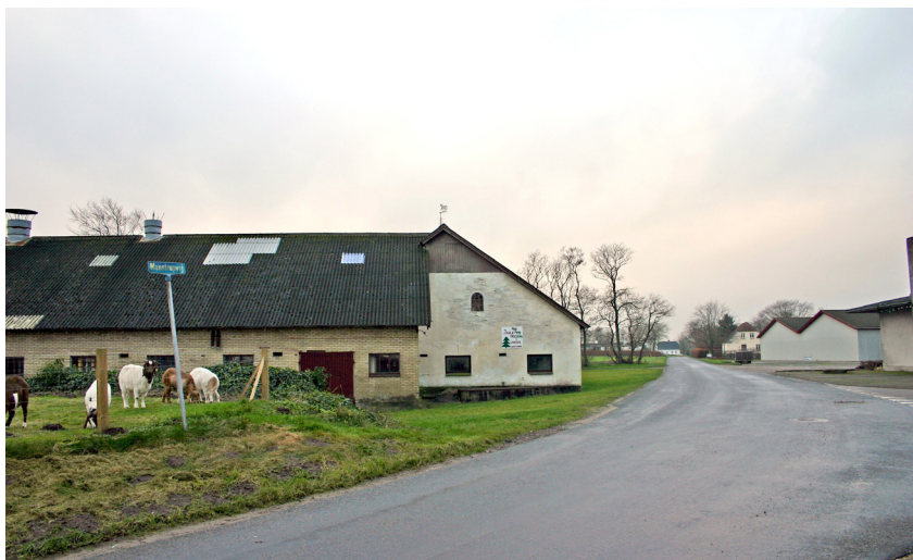
Manstrupvej set fra øst.

Fortestrukturen er i særlig høj grad velbevaret i Manstrup. Den nuværende relativt spredte bebyggelse langs Højlundsvej og Manstrupvej er ganske vist hovedsagelig af yngre dato, men det kan antages, at placeringen synes at lægge sig tæt op af de foregående bebyggelses placering.