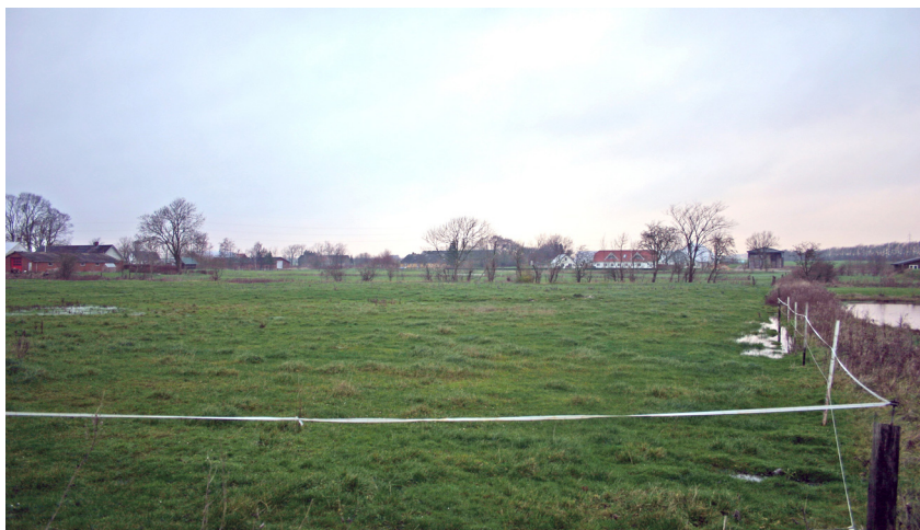
Manstrup gadekærforte set fra syd.

Manstrup er en typisk forteby, hvor bebyggelserne samler sig om et åbent friholdt fællesareal. I Manstrups tilfælde består fortens af et gadekær og et stort sumpet engområde, der tidligere har været helt eller delvist vandfyldt. Landsbyens udformning er således nært sammenhængende med landskabets udformning. I det plane landskab kunne gårdene ganske vist placeres ret frit, men de lave og fugtige arealer kunne vanskeligt bebygges og kom derfor til at udgøre et naturligt defineret centrum for bebyggelsen. Med placeringen omkring den store forte blev Manstrups bebyggelse 'strakt' ud over et meget langt vejforløb. Gårdene kom derfor ikke til at danne de tætte husrækker, der kendes fra andre landsbyer.