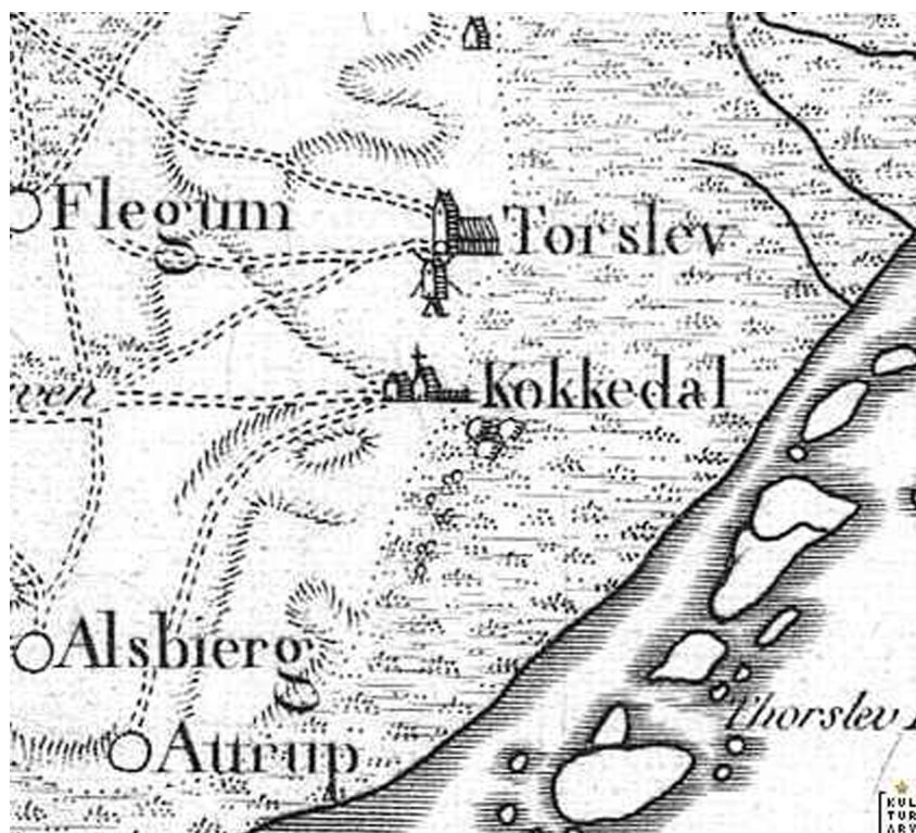
Udsnit af Videnskabernes Selskabs Kort. Aalborg historiske Museum 2006.