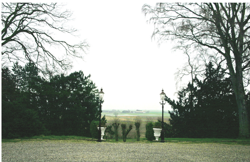
Udsigt til marker mod øst set fra gårdspladsen. Aalborg historiske Museum 2006.

Selve voldstedet, der fik sit nuværende udseende i anden halvdel af 1500-tallet, består af en fire-sidet banke med stærkt afrundede hjørner. Banken, der hæver sig ca. 5, 25 m over vandspejlet i den omgivende grav, måler ca. 80 m i nordvestlig retning og mellem 44 og 61 m i nordøstlig retning. Voldgraven er smallest i syd, hvor den er ca. 7 m bred. Den er bredest i nord, hvor den måler ca. 17 m. En ca. 20 m bred vejdæmning fører over den sydvestre grav, mens en træbro fører over den sydøstre grav. Bankens kanter langs vandspejlet er i syd og øst befæstede dels med kampesten og dels med pæle. Voldgravens udvendige kanter er kampestensbesatte i sydøst og fremtræder langs sydsiden ved det sydøstlige hjørne som en lodret ca. 1,5 m høj kampestensmur.