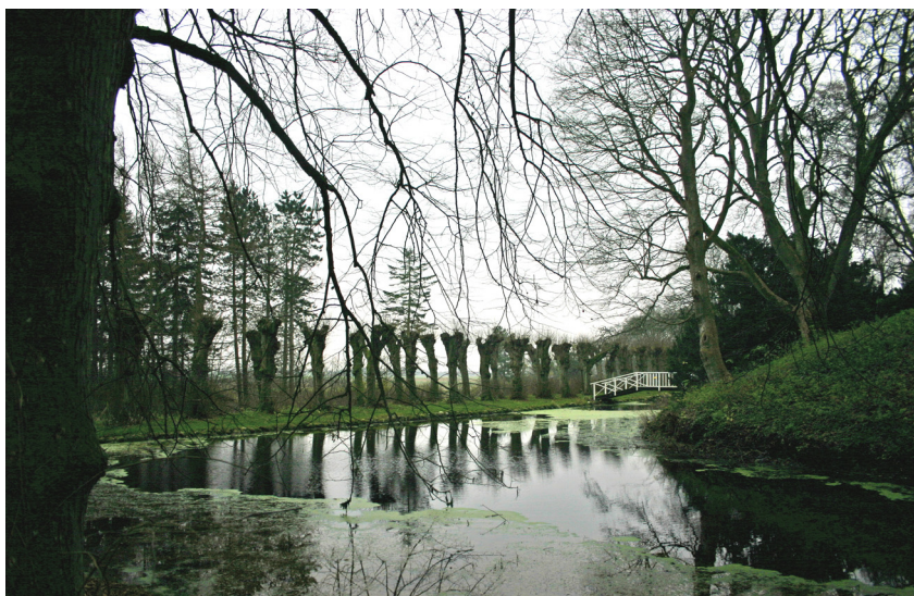
Voldgraven mod nord. Aalborg historiske Museum 2006.

Gravens skråninger er græsklædte med enkelte buske. Langs den nordøstre gravs ydersider forløber en dæmning, der er ca. 13 meter bred og hæver sig ca. 1,5 m over vandspejlet. Langs den sydøstre grav er der en lav, ca. 11 m bred dæmning. På begge sider af dæmningerne er der gangstier, kantet af allé-træer.