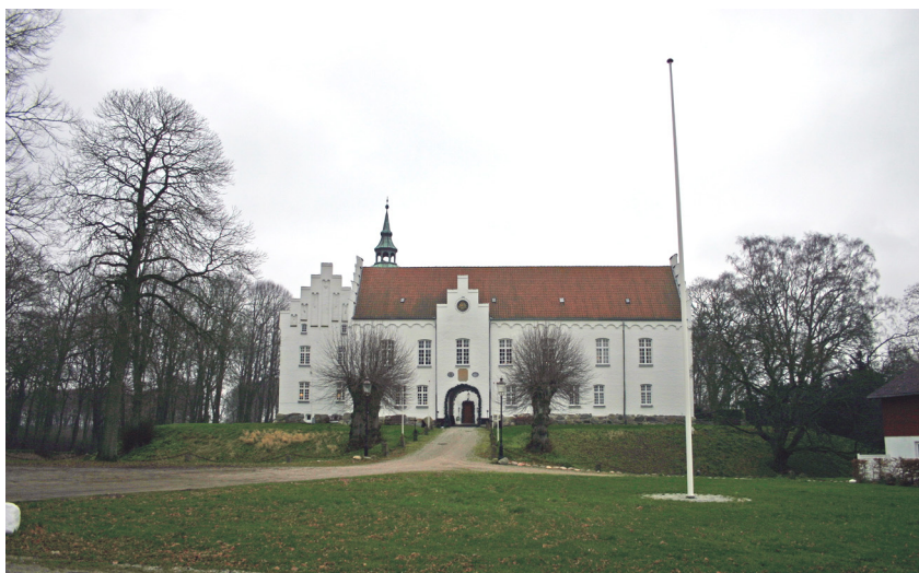
Sydfløjen set fra plænen. Aalborg historiske Museum 2006.