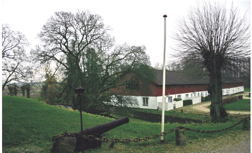
Avlsgården set fra sydfløjens port. Aalborg historiske Museum 2006.

I de omkringliggende omgivelser er det vurderingen, at bakkelandskabet og skovene bidrager til kulturmiljøets sammenhæng. Ændringer såsom nye bygninger eller markante indhug i skovområderne bør derfor undgås.