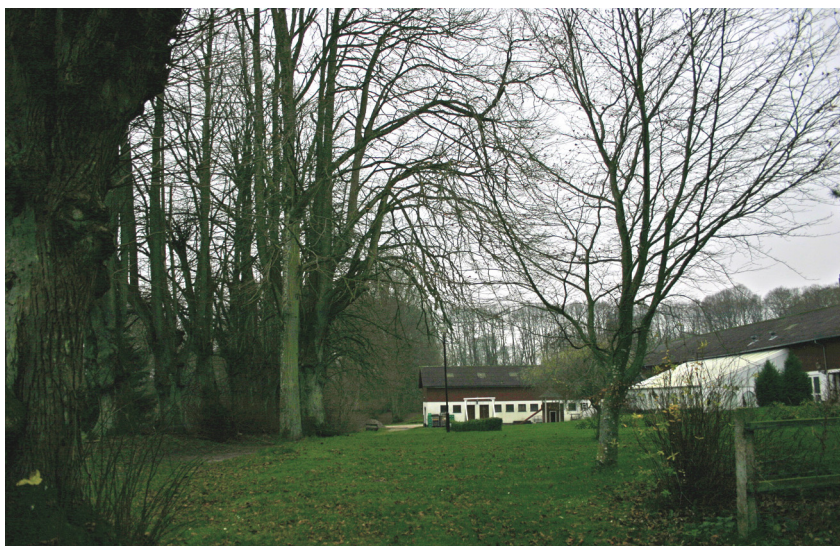
Bagsiden af avlsgården (med svømmebassin).

Der ligger ellers intet i Kokkedals umiddelbare nærhed, der virker forstyrrende på kulturmiljøet. Med tanke på nedbrændingerne i 1600-tallet kan de nuværende skove i slottets næromgivelser medvirke til en understregning af det oprindelige skovrige herregårdsmiljø.