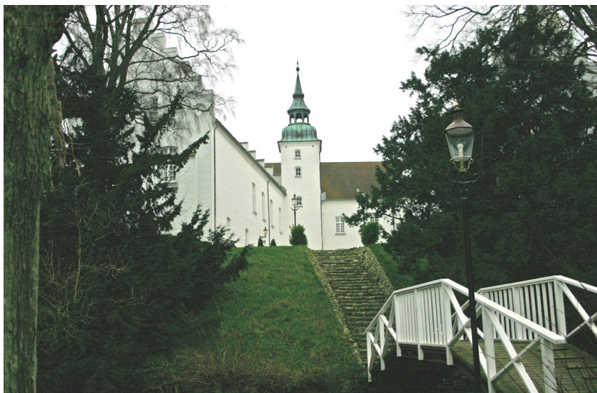
Slotspladsen med tårnet og træbroen set fra øst. Aalborg historiske Museum 2006.

I 1500-tallet var Kokkedal placeret ganske tæt på Limfjorden, der stadig i 1790'erne nåede næsten helt op til Brovst (se Videnskabernes Selskabskort). Med udfyldningerne i 1800-tallet ligger Kokkedal nu meget længere fra kystlinien. Før udfyldningerne prægede våde engområder Kokkedals omgivelser mod Limfjorden, mens skov og marker var en del af landskabet mod vest og nord.