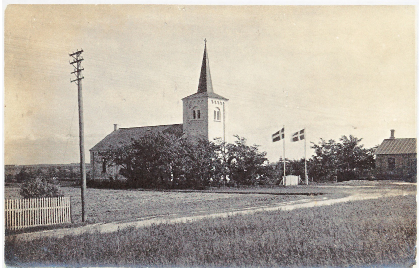
Klim Frimenighedskirke. Indvielse af tårnet 1919 3378

Indvielse af tårnet. Lokalhistorisk Arkiv Fjerritslev.