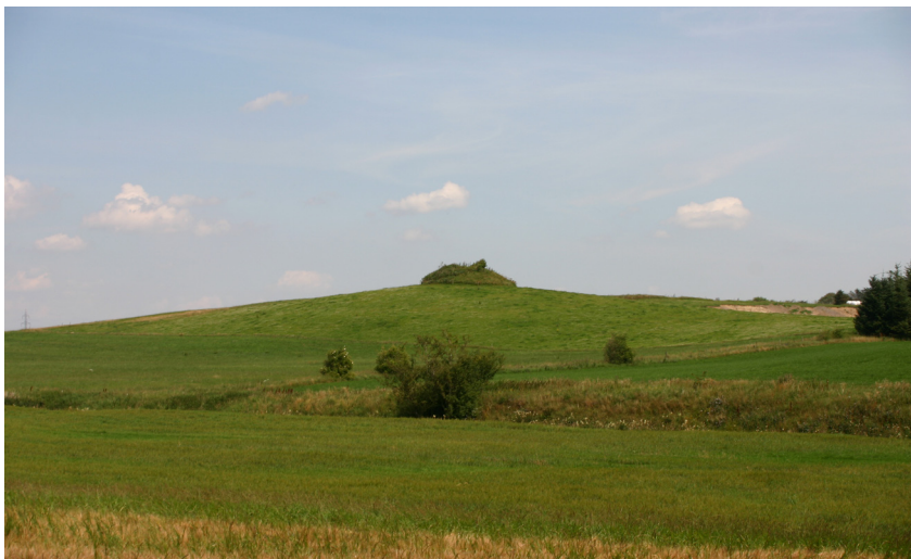
Gravhøj ved Spangdal. Aalborg historiske Museum 2005.

Længst mod syd ligger et areal, der er registreret i DKC som kulturarvsareal, fordi der her kunne konstateres spor efter ældre jernalders digevoldningssystemer som dog ikke kan iagttages umiddelbart.