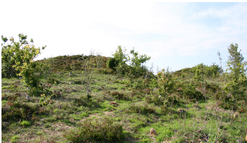
Gravhøje på Egebjerg. Aalborg historiske Museum, 2005.

Øst for Janum Kjøt ligger tre gravhøje på en linie med udsyn over dalen mellem Janum Kjøt og Brandbjerg. Vest for Janum Kjøt ligger en række af gravhøje i sogneskellet. På Egebjerg ligger tre gravhøje smukt placeret på et lille hedeareal.