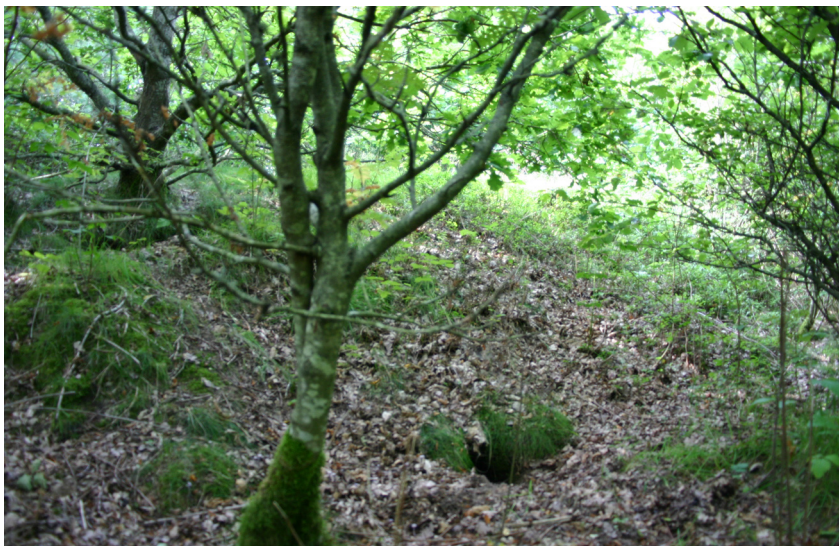
Tilgroet langhøj ved Janum Kjøt. Aalborg historiske Museum 2005.

Længst mod syd ligger et areal, der er registreret i DKC som kulturarvsareal, fordi der her kunne konstateres spor efter ældre jernalders digevoldningssystemer som dog ikke kan iagttages umiddelbart.