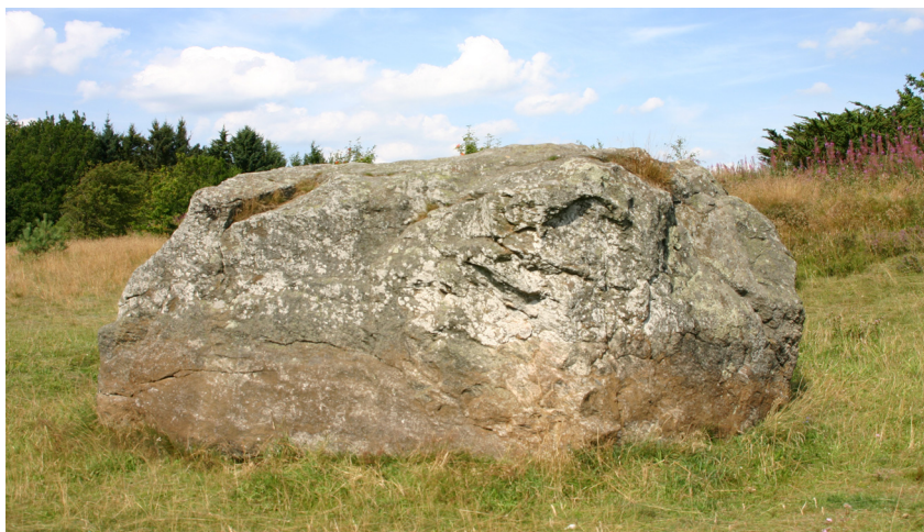
Jættekastet sten ved Janum Kjøt. Aalborg historiske Museum 2005.

Derudover findes på denne bakketop en stor sten, der efter den lokale folketradition er en jættekastet sten. Stenen er en af Danmarks største vandreblokke med en længde på 7 m, bredde på 4 meter og højde på 4 meter.