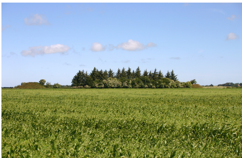
Langdyshøje nord for Manstrup. Aalborg historiske Museum 2005.

Endelig findes i den sydlige del af området en større mængde gravhøje, hvis tilstand dog varierer meget. Længst mod sydvest ligger to mindre høje, der kaldes for Kjerlingehøje. Mod vest forekommer en mængde rundhøje samt den mest interessante konstellation en langhøj, der i hver ende flankeres af en rundhøj. Disse høje bærer navnet Langdyshøje efter langhøjen. Desværre er langhøjen temmelig tilgroet med grønt således, at selve højen ikke kan ses på afstand. Denne konstellation af gravhøje har dog oprindeligt været en del af en større koncentration af rundhøje omkring langhøjen.