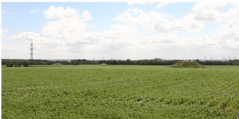
Kjerlinghøje nord for Manstrup. Aalborg historiske Museum 2005.

Endelig findes i den sydlige del af området en større mængde gravhøje, hvis tilstand dog varierer meget. Længst mod sydvest ligger to mindre høje, der kaldes for Kjerlingehøje. Mod vest forekommer en mængde rundhøje samt den mest interessante konstellation en langhøj, der i hver ende flankeres af en rundhøj. Disse høje bærer navnet Langdyshøje efter langhøjen. Desværre er langhøjen temmelig tilgroet med grønt således, at selve højen ikke kan ses på afstand. Denne konstellation af gravhøje har dog oprindeligt været en del af en større koncentration af rundhøje omkring langhøjen.