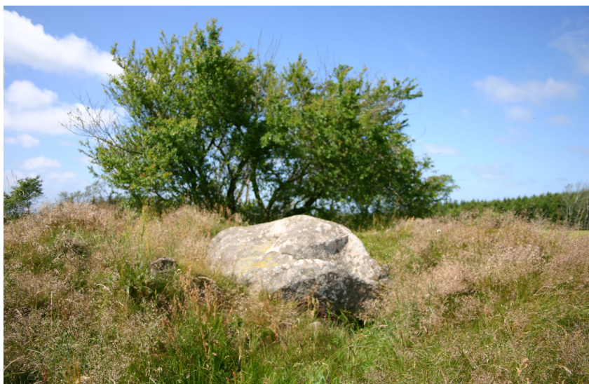
Stendysse Nordvest for Kollerup. Aalborg historiske Museum 2005.

Ved Sønderbjerg får tilskueren imidlertid ikke samme oplevelse af højenes markante placering i landskabet, idet gravhøjene her ligger i et lille plantageareal. Vest for Hingelbjergerne på den anden side af vejen mod Fjerritslev findes nogle enkeltliggende gravhøje af anseelig størrelse, nemlig Hvilshøj og Øster Fladhøj. Disse gravhøje er ligeledes temmelig tilgroede i krat. Sydligt i området findes ligeledes flere enkeltliggende gravhøje som Hvashøj, Baunehøj og Møgelhøj. Nordvest for landsbyen Kollerup ligger en dysse fra yngre stenalder.