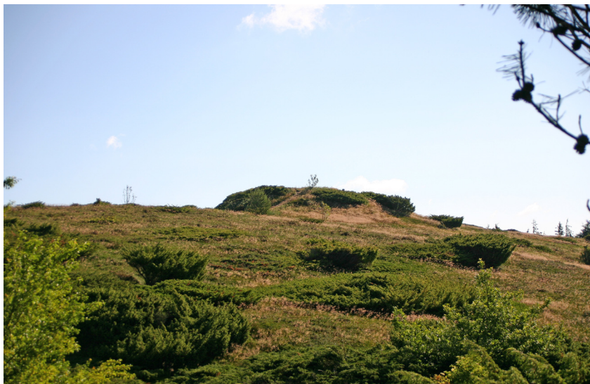
Nordbjerg ved Hingelbjerg. Aalborg historiske Museum 2005.

Ved Sønderbjerg får tilskueren imidlertid ikke samme oplevelse af højenes markante placering i landskabet, idet gravhøjene her ligger i et lille plantageareal. Vest for Hingelbjergerne på den anden side af vejen mod Fjerritslev findes nogle enkeltliggende gravhøje af anseelig størrelse, nemlig Hvilshøj og Øster Fladhøj. Disse gravhøje er ligeledes temmelig tilgroede i krat. Sydligt i området findes ligeledes flere enkeltliggende gravhøje som Hvashøj, Baunehøj og Møgelhøj. Nordvest for landsbyen Kollerup ligger en dysse fra yngre stenalder.