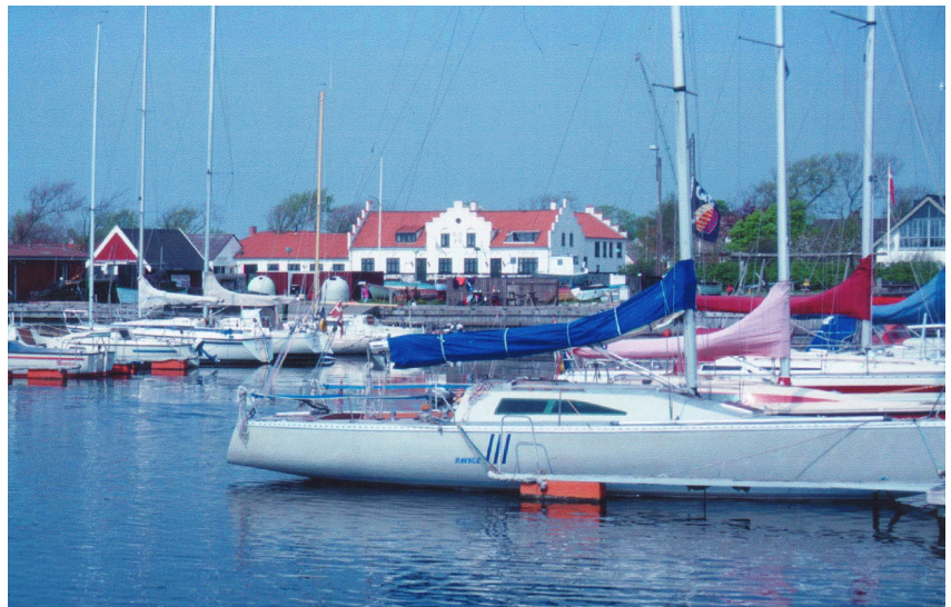
Gjøl Havn med lystbåde og kro. Viggo Petersen 2000.

Det omtalte tjæreanlæg er restaureret og velbevaret og udgør, trods den forurening tjæren må formodes at have forvoldt, en stor seværdighed. Herregården Birkumgård er delvis bevaret. Gjøl bys huse optræder i næsten alle tilfælde i gennemmoderniseret tilstand. Kroen har dog en smuk facade ud mod havnen. Isbakken er et stemningsfuldt sted stort set uden forstyrrende elementer.