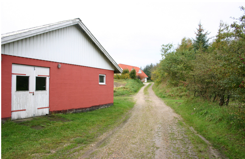
Telling Bygade. Morten Pedersen 2006.

Tellings velbevarede karakter som slynget vejby vil være sårbar overfor udvidelser eller ændringer i bebyggelsen, der afviger fra landsbyens oprindelige struktur. Tilsvarende vil en udvidelse og en moderne belægning af det slyngede vejforløb (Telling Bygade) med f.eks. asfalt fjerne et væsentligt element i landsbyens autentiske præg. Oplevelsen af kulturmiljøet er i dag vanskeliggjort ved Telling Bygades omdannelse til blinde vejforløb. En eventuel åbning af det gamle vejforløb for vandrende og/eller en formidling af landsbyens oprindelige karakter ville være et væsentligt redskab til formidling – og oplevelse – af kulturmiljøets værdier.