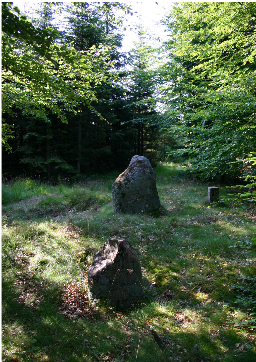
Den Grå Sten i Fosdal Plantage. Aalborg historiske Museum 2005.

Lidt sydvest for denne linie af gravhøje findes Rødland Hede, der er et af Danmarks bedst bevarede arealer med spor efter ældre jernalders agersystemer i form af digevoldinger. Den anseelige størrelse af digevoldingerne på dette sted vidner om, at marksystemerne sandsynligvis har været i brug over en længere periode. Endelig ligger flere enkeltliggende gravhøje i området sydøst for plantagen.