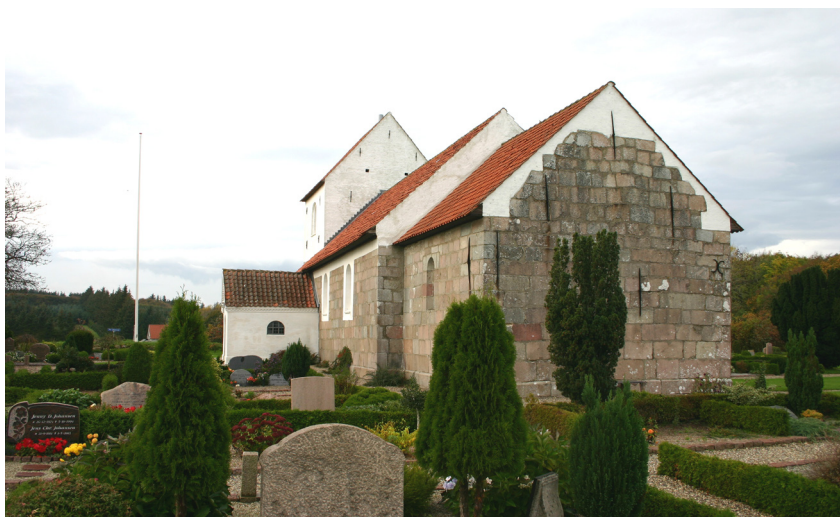
Lerup kirke set fra øst. Morten Pedersen 2006.

Kirken består af kor, skib, tårn mod vest og våbenhus mod syd. Det romanske kor og skib er opført af granitkvadre på en skråkantsokkel, mens det senmiddelalderlige tårn er opført af blandede materialer – dels kvadre fra skibets tidligere vestgavl dels rå kampesten og tegl. Våbenhuset er opført i nyere tid.