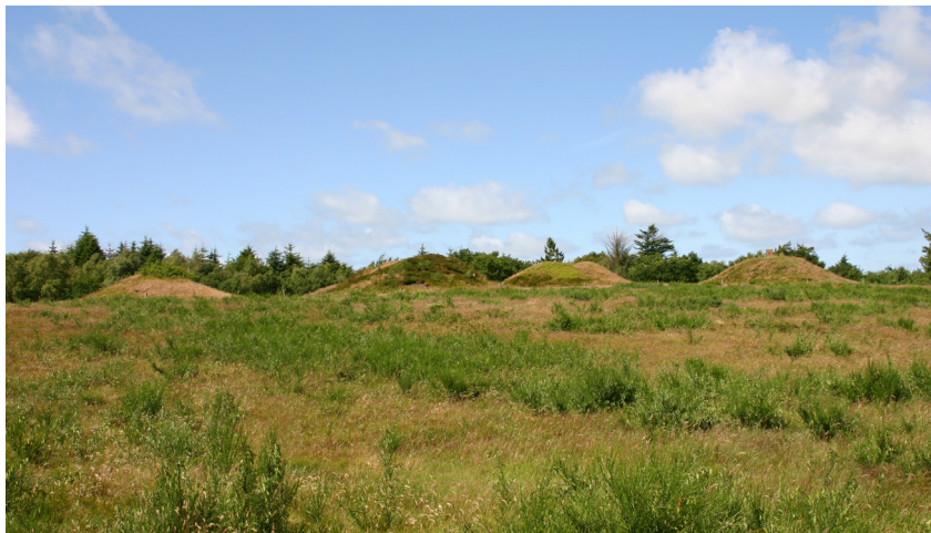
Højgruppe på Korsbakke.

Omkring Skolemesterens høj ligger en mængde gravhøje, der ikke var lettilgængelige på besigtigelsestidspunktet, og derfor besigtigedes kun den sydvestlige del af denne højgruppe. Flere af disse høje var tilgroet med krat og mindre træer. Vest for Skolemesterens høj ligger en samling gravhøje på Korsbakken, der er et lille hedeareal øst for selve plantagen. Fra Lerup Bavnehøj, der er den højeste af de 8 gravhøje på Korsbakken, er der god udsigt over det fladere terræn mod nord, og i klart vejr kan havet ses herfra. Nordvest for denne koncentration ligger endnu to koncentrationer af henholdsvis 6 og 12 gravhøje som to parallelle linier, der følger toppen af hver sin bakkekam, der er orienteret SSV-NNØ. Disse høje er meget velholdte og ligger som små græsklædte lysninger i den tætte plantage. Længere mod nordvest udenfor det tidligere udpegede kulturmiljøareal ligger på hver sin side af Lilledalen en gravhøj på et lille hedeareal. Sydvest herfor ligger endnu 8 gravhøje på en linie fra nord mod syd. De fleste af disse gravhøje er af væsentlig størrelse med Gravenhøj som den største med sine 5 meters højde.