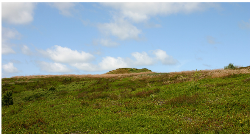
Gravhøj ved Lilledal. Aalborg historiske Museum 2005.

Omkring Skolemesterens høj ligger en mængde gravhøje, der ikke var lettilgængelige på besigtigelsestidspunktet, og derfor besigtigedes kun den sydvestlige del af denne højgruppe. Flere af disse høje var tilgroet med krat og mindre træer. Vest for Skolemesterens høj ligger en samling gravhøje på Korsbakken, der er et lille hedeareal øst for selve plantagen. Fra Lerup Bavnehøj, der er den højeste af de 8 gravhøje på Korsbakken, er der god udsigt over det fladere terræn mod nord, og i klart vejr kan havet ses herfra. Nordvest for denne koncentration ligger endnu to koncentrationer af henholdsvis 6 og 12 gravhøje som to parallelle linier, der følger toppen af hver sin bakkekam, der er orienteret SSV-NNØ. Disse høje er meget velholdte og ligger som små græsklædte lysninger i den tætte plantage. Længere mod nordvest udenfor det tidligere udpegede kulturmiljøareal ligger på hver sin side af Lilledalen en gravhøj på et lille hedeareal. Sydvest herfor ligger endnu 8 gravhøje på en linie fra nord mod syd. De fleste af disse gravhøje er af væsentlig størrelse med Gravenhøj som den største med sine 5 meters højde.