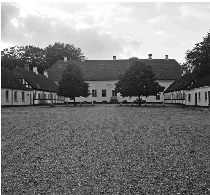
Nordfløjen med åen. Viggo Pedersen 1986.

I 1819 nedbrændte Birkelses nordvestlige sidefløj ud mod åen og den sydvestlige sidefløj ud mod haven, og da sidefløjene atter blev opført, benyttede man lejligheden til at omlægge hele anlægget, så husets orientering blev vendt om. Nybyggeriet fandt således sted på den modsatte side af hovedbygningen, mens den gamle gårdsplads blev lagt til haven. Samtidigt blev den grundmurede hovedbygning forlænget i begge ender i to etager, mens den midterste af etagerne i den gamle midterdel blev sløjfet og et tomt mellemrum fik lov at stå mellem stuen og tagetagen. I den form har Birkelses hovedbygninger fået lov at stå frem til i dag, hvor det end-nu udgør kernen i en aktiv landbrugsvirksomhed.