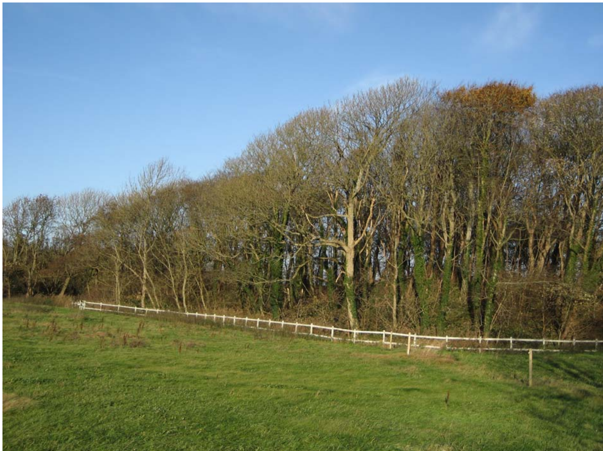
Ågård med en del af engen. Kirsten Monrad Hansen 2006.

Sted/topografi: Ågård i Vester Han herred ligger syd for den nuværende by Fjerritslev. Voldstedet er i dag omgivet af engdrag, som oprindeligt var en sø. I dag løber Mølleå nord og nordvest for anlægget, og nord for Ågård findes der også et mindre vådområde.